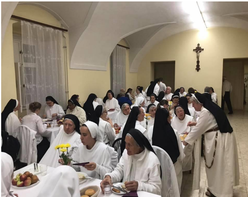
Tout cela était très bon!