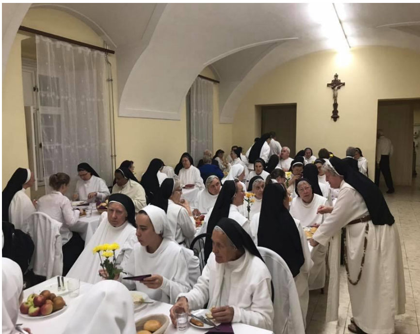
Tutto aveva molto buon gusto!